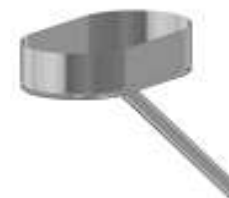
Miska pre odvod kondenzátu